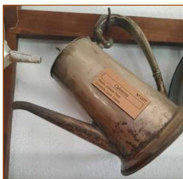
CAFETEIRA DOADO: ADELAIDE TOMÉ